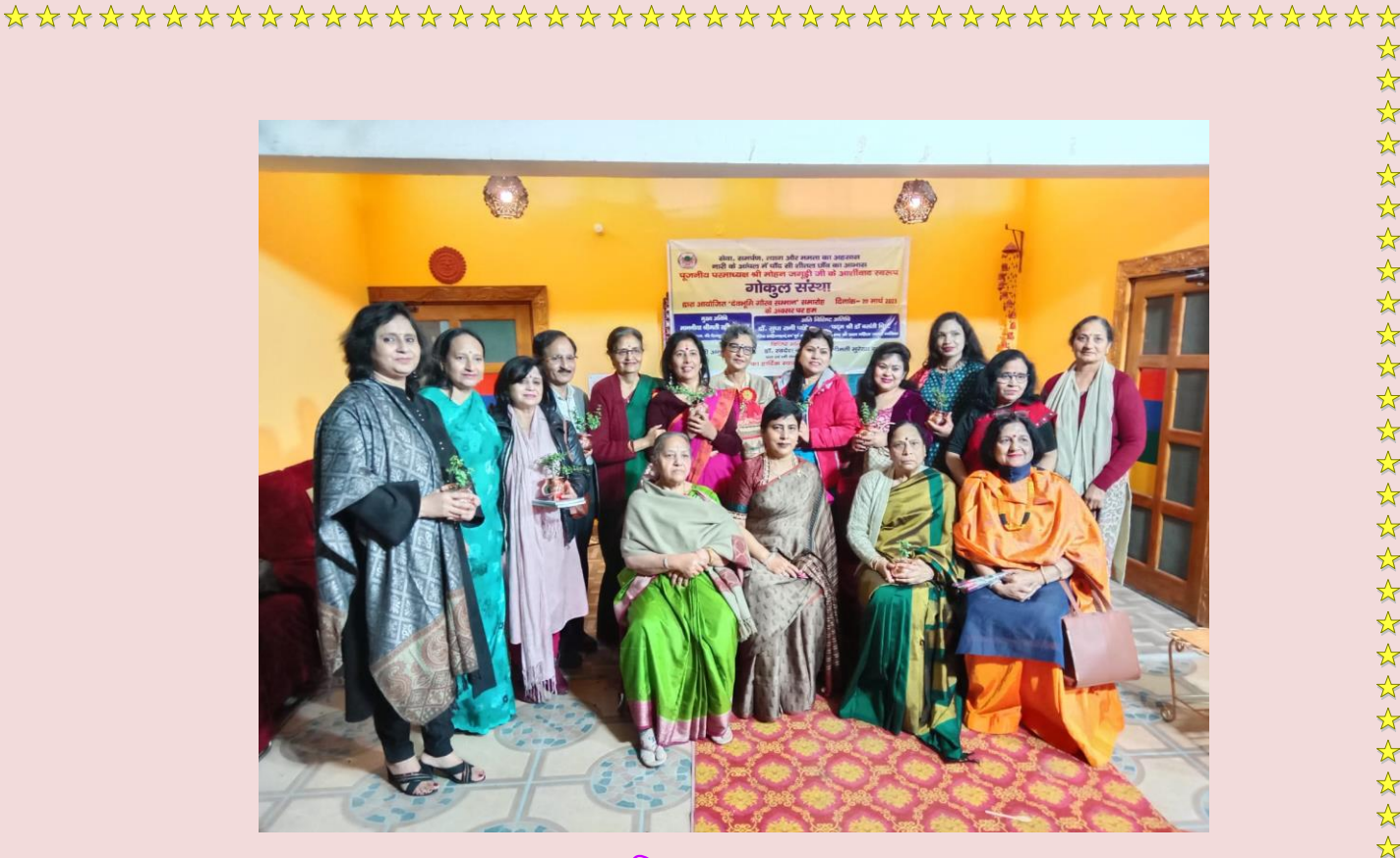
उपस्थित जन समूह